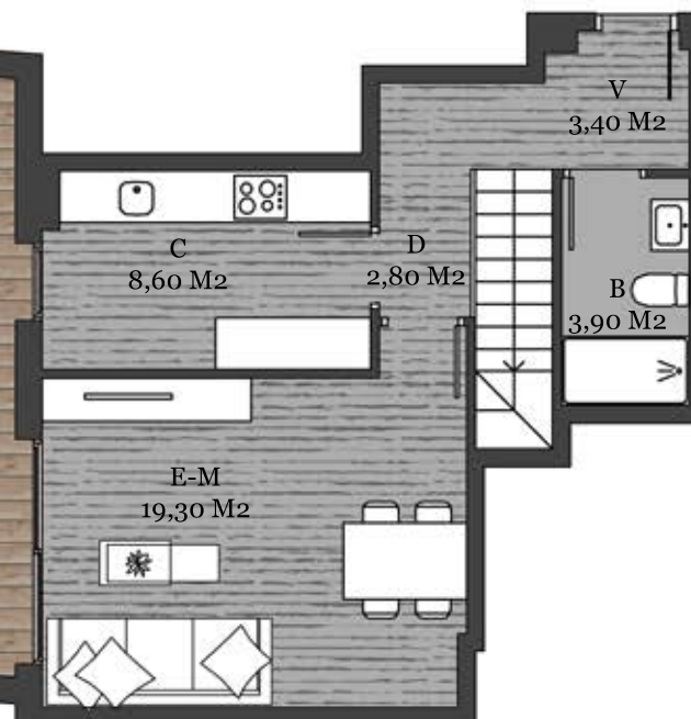
Esc A. Planta B - Porta 2

Plànol orientatiu que no constitueix document contractual, subjecte a modificacions per exigències administratives, tècniques o jurídiques derivades de la obtenció de les llicències i permisos reglamentaris, així com per necessitats constructives durant l'obra. Les superfícies tenen caràcter provisional fins a la obtenció de l'al·licència de primera ocupació. El mobiliari és fictici, i no forma part de l'habitatge.